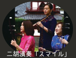
二胡演奏「スマイル」