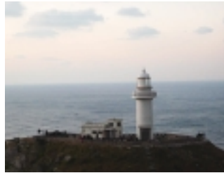
映画「悪人」のクライマックスシーンはこの灯台で撮影されました。

途中いきなり東シナ海が眼前に広がります。荒波に海蝕された高さ80mの断崖、此处から見る水平線に沈む夕日は最高です。