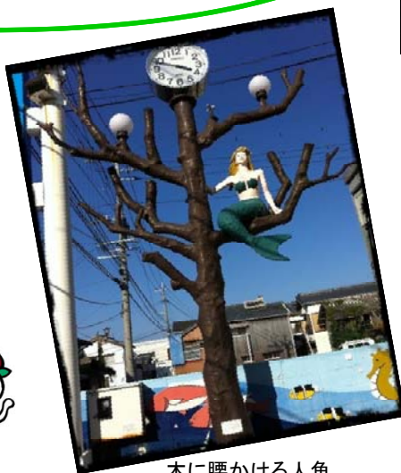
木に腰かける人魚