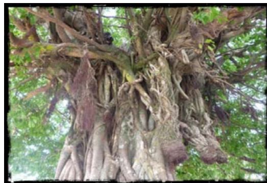
下へと垂れる気根

見上げると、枝や幹から気根(地上茎から出た根)を垂らしているのが分かるよ！！ アコウの樹は、他の木に絡まりながら成長し、やがて元の本を締め殺してしまう成長の仕方から、別名「締め殺しの木」とも呼ばれているんだよ！！