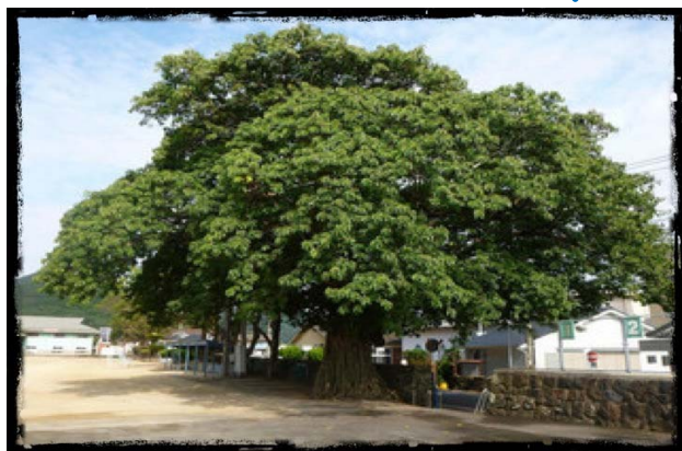
富江小学校のアコウ樹

富江小学校のグラウンドには、大きなアコウ樹があるんだよ！ 校歌には「窓を開ければガジュマルの～♪♪」という歌詞があるんだけど、ガジュマルじゃなくて実はアコウの樹なんだ☆