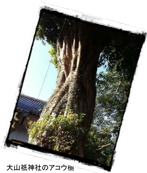
大山祇神社のアコウ樹

富江の大山祇神社にも、大きなアコウの樹があるよ！神社のすぐ横にドッシリとかまえているように見えるね。アコウ樹の下には、楕円形の力石があるんだよ♪♪昔はこれで力比べをしていたんだって！力いっぱい頑張ったけど、つばきねこは持ち上げられなかったよ～。