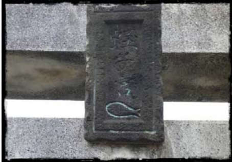
蛭子宮の神社名札