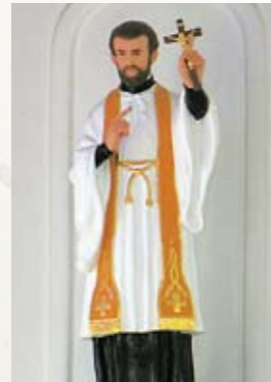
聖フランシスコ・ザビエル像(奈留教会)

キリストや聖母マリア、聖ヨゼフの聖家族像のほか、各教会が「教会の保護者」としている特定の聖人像がある。