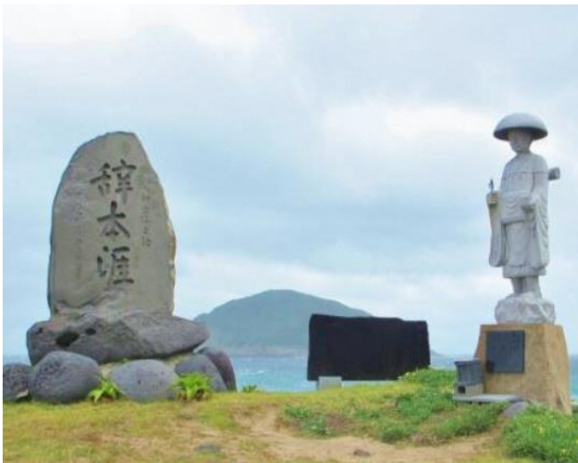
五島市：辞本涯の碑(空海記念碑)

我が国はロシア、韓国、台湾、中国などと海を隔てて国境を接し、長い歴史の中でさまざまな関係がありました。ぜひ皆様の感性で作り上げ、経験した素敵な「ボーダー体験記」をご紹介ください。