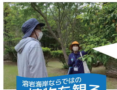
溶岩海岸ならではの 植物を観る