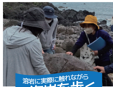
溶岩に実際に触れながら 海岸を歩く