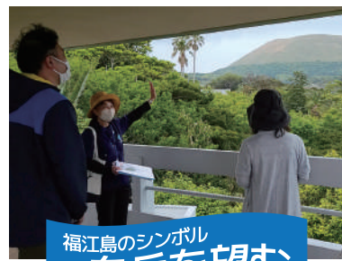
福江島のシンボル 鬼岳を望む