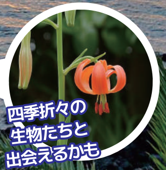
四季折々の 生物たちと 出会えるかも

開催日時 毎週 土曜日 日曜日 の1日2回開催 第1部: 10時00分 第2部: 14時00分 所要時間: 約 50分