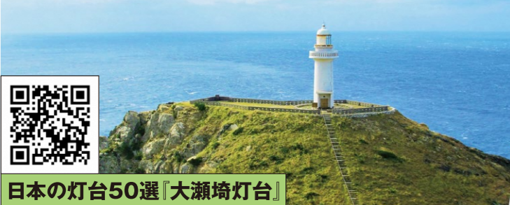
日本の灯台50選「大瀬埼灯台」

九州本土で最も遅い時間に夕陽が沈む場所、断崖絶壁の上に建つ白い灯台は、青い海とのコントラストが美しく、「日本の灯台50選」に選ばれています。