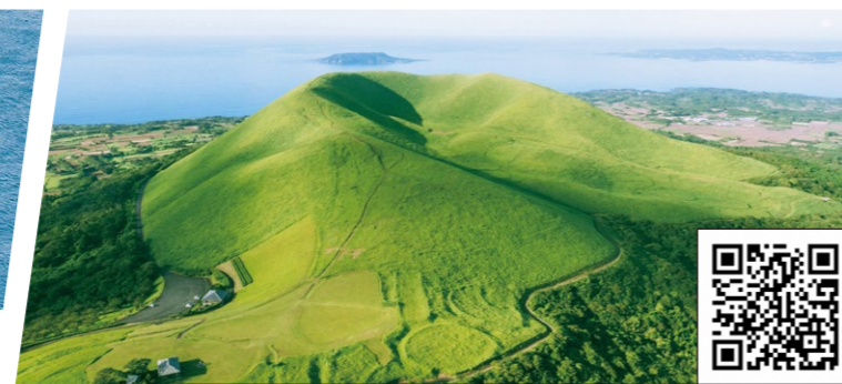
登っても眺めても楽しい福江島のシンボル「鬼岳」

登っても眺めても楽しい福江島のシンボル。鬼岳は2023年5月に「未来に残したい草原の里100選」へ選定されました。