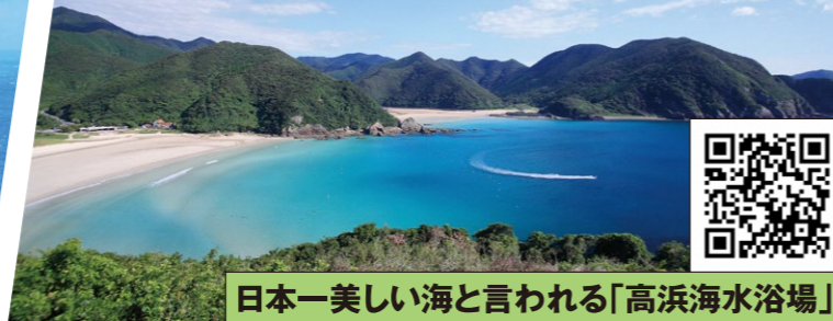
日本一美しい海と言われる「高浜海水浴場」

〒853-0411 長崎県五島市玉之浦町玉之浦 TEL:0959-87-2216(五島市玉之浦支所地域振興班) 福江港から展望所まで車で約55分 ①無料